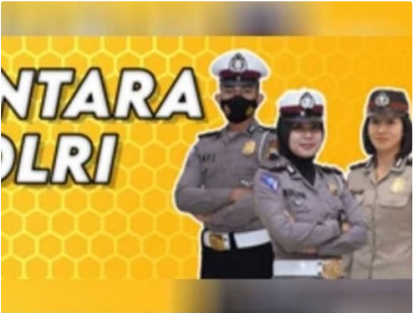
Penerimaan Polri Bakomsus

PALANGKA RAYA - Kesempatan terbuka bagi lulusan bidang pertanian, perikanan, peternakan, gizi, dan kesehatan masyarakat untuk bergabung menjadi anggota Polri melalui program penerimaan Bintara Kompetensi Khusus (Bakomsus).